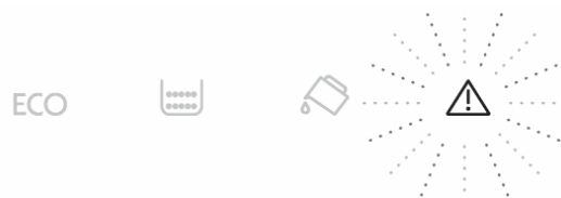
“Insert Infuser Assembly” on Coffee Machines without Display

CAUSE OF THE PROBLEM: The appearance of the message “ Insert Infuser Assembly ” even when the infuser is physically installed in the machine is usually caused by a degradation of the reading of the maximum height by the electronics of the coffee machine.